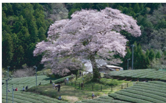
牛代の水目桜 大井川鉄道家山駅から4.0km

樹齢300年の江戸彼岸桜、茶畑の中で淡紅色の花を咲かせる桜を、多くの人が見に訪れます。機会があれば今年、牛代の水目桜を見に来てみてはどうでしょうか。