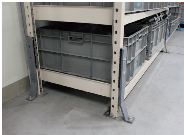
専用金具を使ったアンカー固定

まずは、“身を守る”ことを第一に行動できるよう日頃から安全対策の重要性を意識して災害に備えておきましょう。