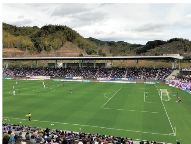
J2基準の収容人数1万人以上を達成したスタジアム

スタジアムは大規模災害時に藤枝市の防災拠点となることから防災備蓄倉庫も備えています。